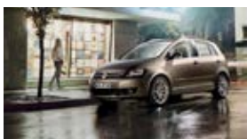
Golf VI / Jetta / Golf Plus depuis 2009