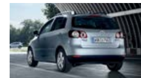
Golf V / Golf Plus de 2008