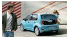
up! / e-up! / Fox