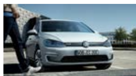
Golf VII / Golf Sportsvan / e-Golf