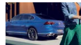
Passat / Passat CC / CC