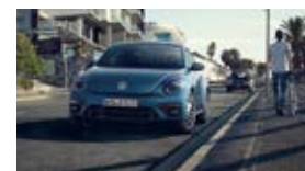
New Beetle / Coccinelle