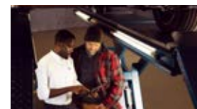
Les opérations complémentaires