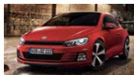
Scirocco / Eos