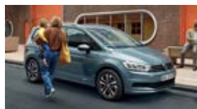
Touran / Sharan